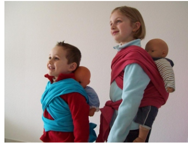
Echarpes porte poupée

"Le bonheur d'être porté... et de porter"