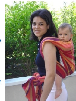
Tina & sa maman