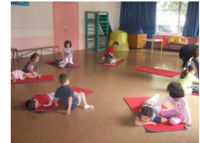
Relaxation et massage en grande section de maternelle

"Plaisir de se relaxer, de masser et d'être massé..."