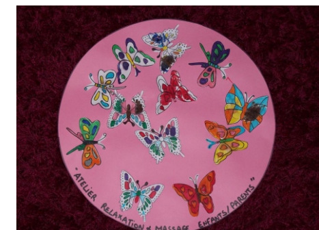
Mandala, outil de relaxation réalisé par des parents et leurs enfants